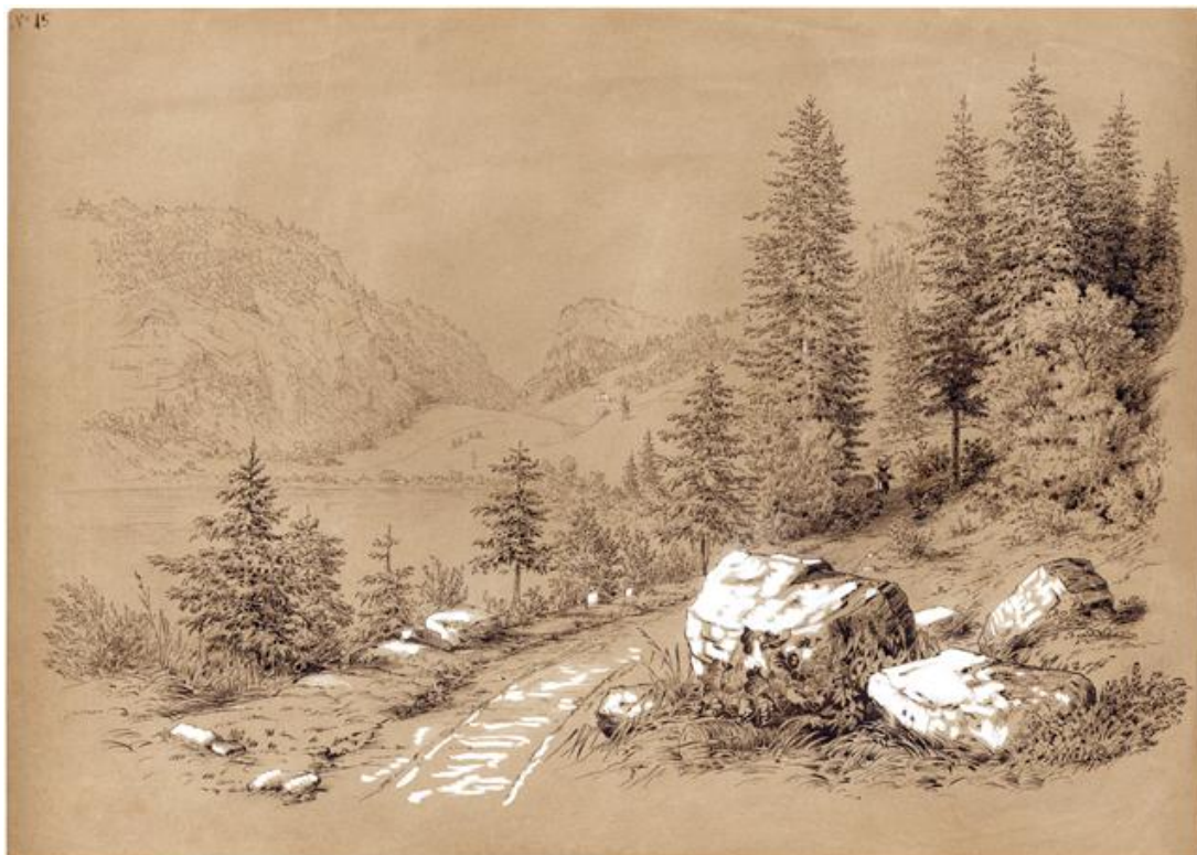
La route de la rive orientale du lac Brenet au milieu du XIXe siècle. Ce n'était guère qu'un chemin pour char et chevaux, mais néanmoins très fréquenté, ne serait-ce que pour aller à la Tornaz où se trouvait un vaste territoire agricole.