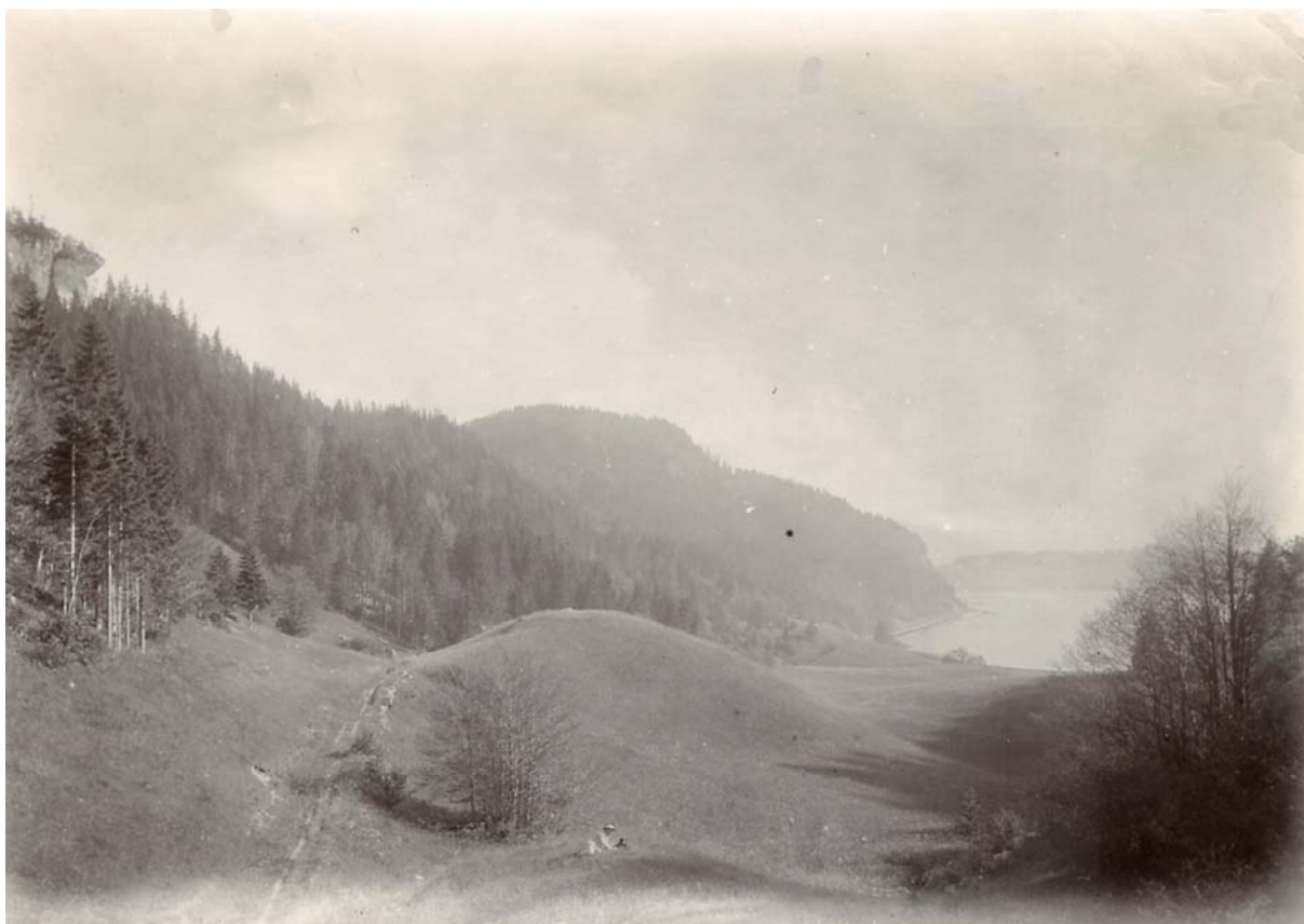
La moraine frontale du glacier de la Vallée de Joux. Le chemin du Mont d'Orzeires est à peine marqué à gauche de notre photo.