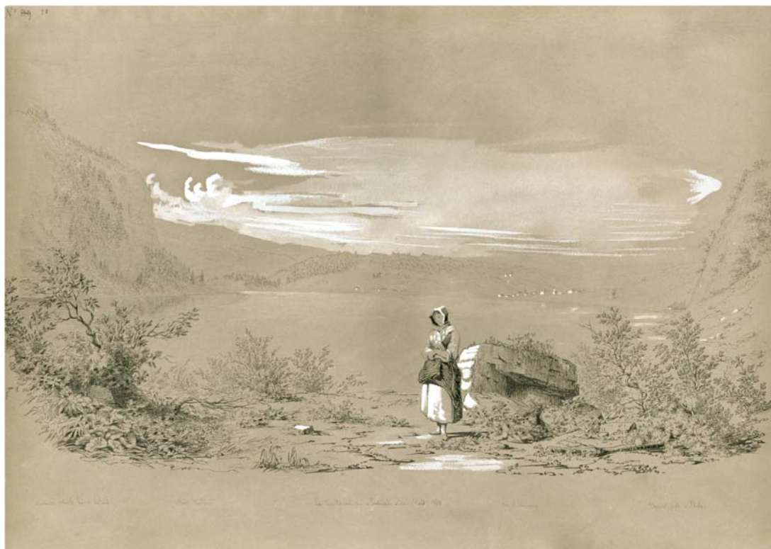
Aux environs de la Tornaz, ce chemin change de côté du vallon, pour retrouver son axe initial un peu plus loin, situation que l'on peut découvrir sur la carte de la page suivante.