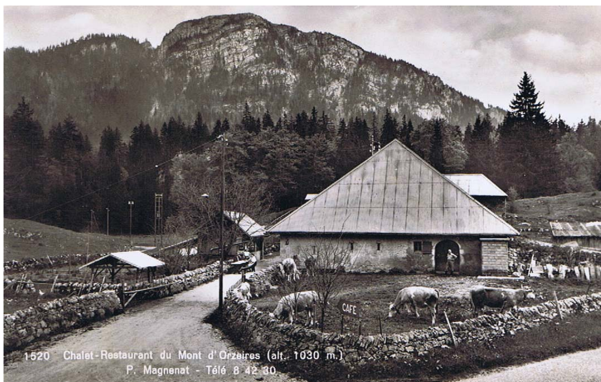
Il existe de nombreuses cartes postales et photos de cet endroit qui connaîtra le plein succès touristique ces dernières décennies avec la mise en place de Juraparc : bisons, loups, ours et compagnie font bon ménage !